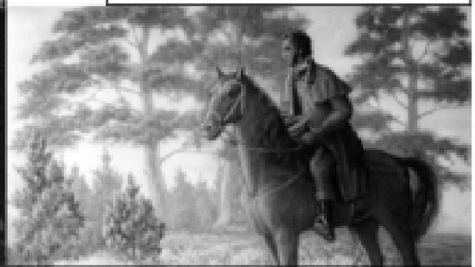
Пушкин в Михайловском