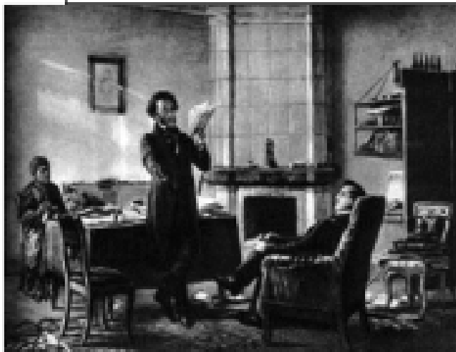
Ге «Пушкин в Михайловском»