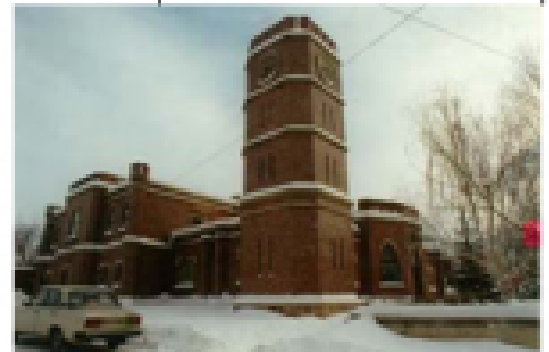
гауптвахта Зимнего Дворца