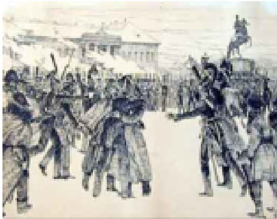
Восстание на сенатской площади